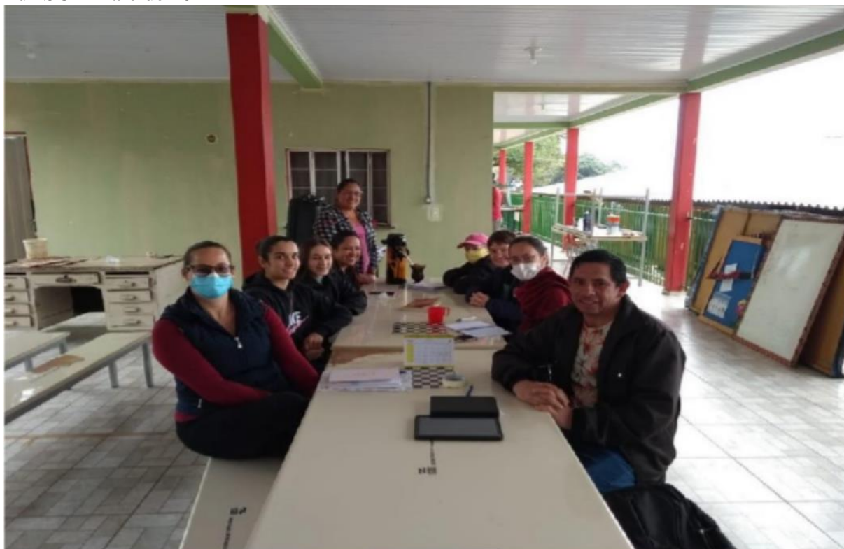
Figura 1 – Visita à escola indígena Cacique Karenh, Terra Indígena Toldo Imbu, Abelardo Luz SC – maio de 2022