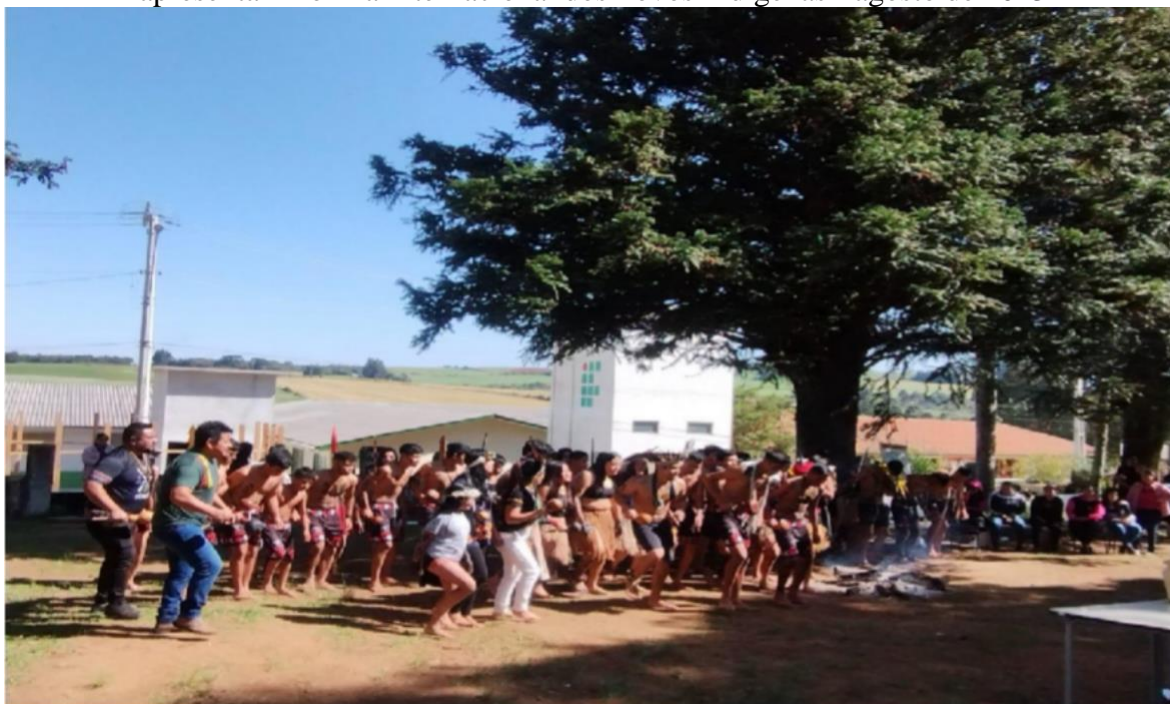
Figura 6 – Grupos de dança da Terra Indígena Toldo Imbu e Terra Indígena Xapecó se apresentam no Dia Internacional dos Povos Indígenas - agosto de 2023