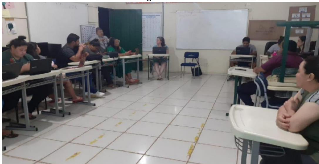
Figura 2 – Aulas do Curso de Qualificação Profissional Práticas Pedagógicas na Educação Indígena – 2022