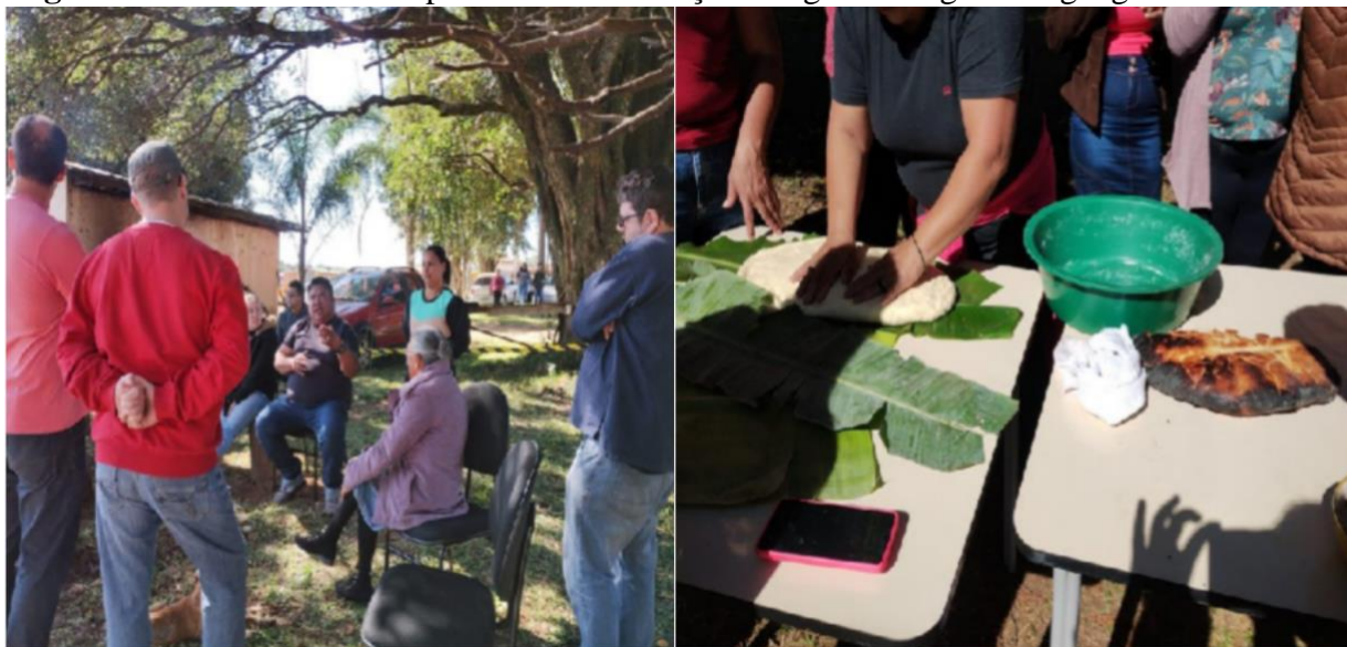
Figura 4 – Atividade no campus sobre alimentação indígena e língua kaingang - maio de 2023

Fonte: acervo pessoal dos autores (2023).