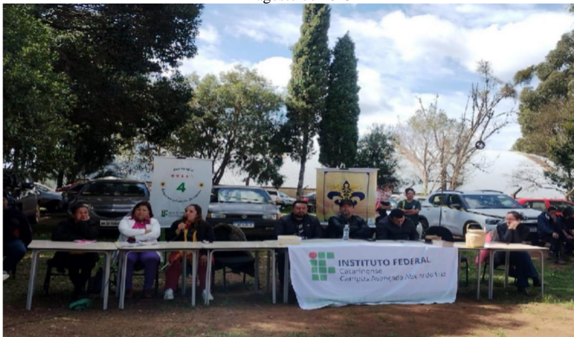
Figura 5 – Abertura da atividade no campus sobre o Dia Internacional dos Povos Indígenas - agosto de 2023