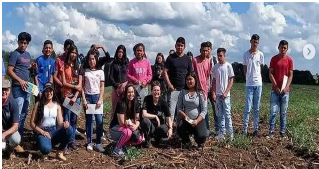
Figura 3 – Visita de professores e estudantes indígenas da escola Pinhalzinho (TI Xapecó) ao Campus Abelardo Luz – setembro de 2022