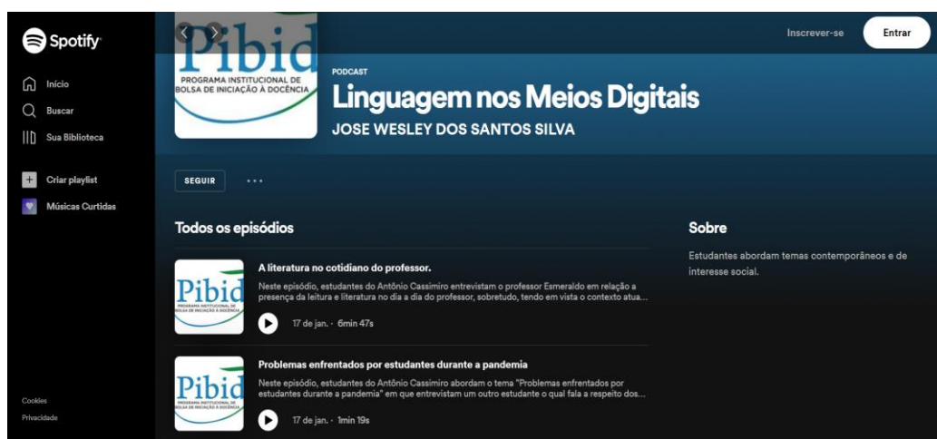
Figura 2. Podcast: linguagem nos meios digitais

Como se observa no trecho acima, as perguntas são muito diretas e não suscitam do entrevistado uma resposta muito elaborada, de modo que o diálogo se apresenta sobremaneira estanque. Embora note-se na última linha uma resposta que sugere uma interação entre entrevistador e entrevistado em “ótimo”, a interação se apresenta muito limitada. Contudo, ao longo dos módulos da sequência, pôde-se observar que os discentes apresentaram grande evolução. A fim de exemplificar, segue abaixo, no quadro 1, o link de duas produções em que se contrasta a primeira produção de uma equipe com a produção final.