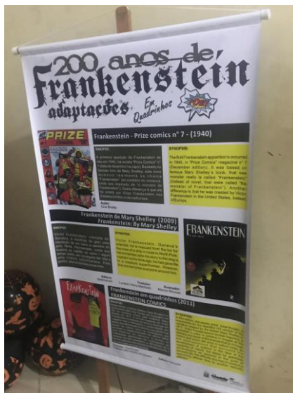
Figura 2 - Banner bilíngue contendo o mapeamento das adaptações em quadrinhos