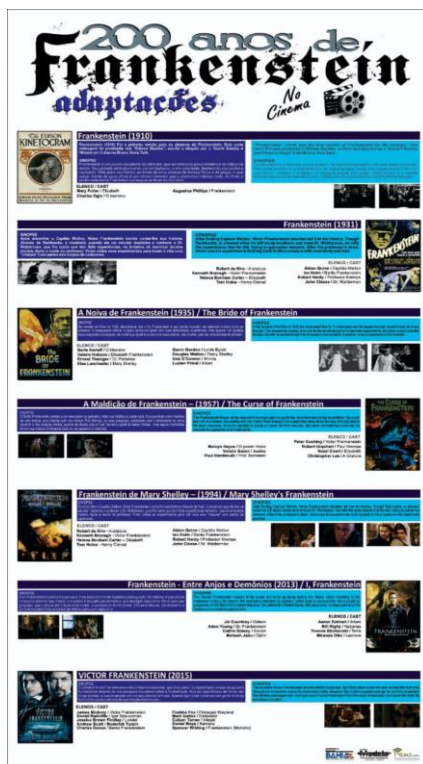
Figura 4 - Banner bilíngue contendo o mapeamento das adaptações no cinema