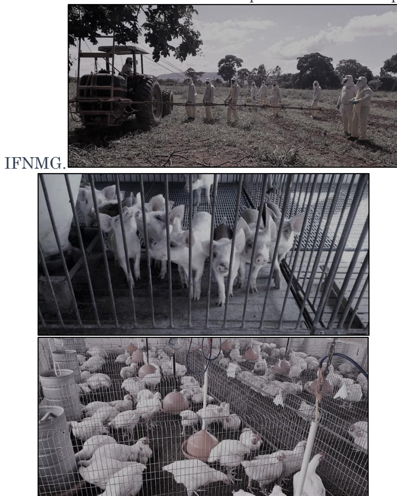
Figura 2- Mosaico da estrutura da fazenda experimental do Campus Arinos do

Os cursos ofertados possibilitam inserção dos estudantes no mercado de trabalho, além de atender pequenos, médios e grandes produtores, ou seja, a educação contribuindo na promoção do desenvolvimento socioeconômico regional. Nesse viés, o Campus Arinos do IFNMG, busca atender a comunidade regional como diversas parcerias, a exemplo da Copabase. O Campus Arinos do IFNMG apresenta infraestrutura com laboratórios, restaurantes, área de lazer, biblioteca, salas de aulas amplas com ar-condicionado, fazenda experimental (Figura 2).