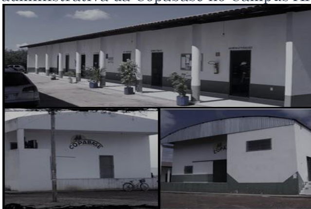
Figura 4- Sede administrativa da Copabase no Campus Arinos do IFNMG.

No que se refere à infraestrutura pode-se apontar que a Copabase apresenta espaços que atende aos cooperados, logicamente sempre em busca de melhorias. A sede administrativa (Figura 4), assim como o local de beneficiamento das frutas e entreposto de mel com capacidade de processamento ficam na área do Campus de Arinos.