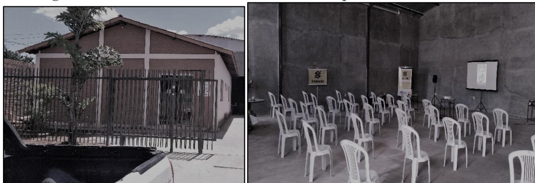
Figura 5- Mosaico da infraestrutura da Copabase em Arinos-MG.

Em Arinos na área central da cidade ficam a unidade de beneficiamento da castanha do baru; o galpão para reuniões e outras atividades dos cooperados e a loja Central Vereda; a cooperativa tem veículos para transporte dos produtos, maquinário que atende a demanda (Figura 5), e até congeladores personalizados com as polpas de frutas em supermercados. Existem também outros pontos de comercialização dos produtos nos demais municípios da área de abrangência da Copabase, além de um box no Mercado Municipal de São Paulo.