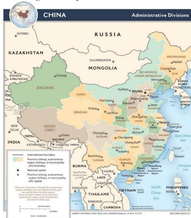
Figura 3 - Mapa administrativo da China

Sendo uma das maiores províncias do Estado, ocupando uma área de 1'228,400 km 2 , sua extensão é mais um motivo que outorga a importância do Tibete. A proteção do conjunto territorial é fundamental para a segurança política e econômica chinesa, garantindo o desenvolvimento do Estado. Isto posto, infere-se que a perda de um território tão vasto e rico seria um grande prejuízo, afetando a China em diversas esferas (FREEMAN, 2011; NOTARIO, 2015). Assim como pode ser visto no mapa administrativo da China, abaixo (Figura 3), é possível notar que a região denominada de Xizang, em marrom, no sudoeste do Estado correspondente ao território tibetano, é uma das maiores províncias.