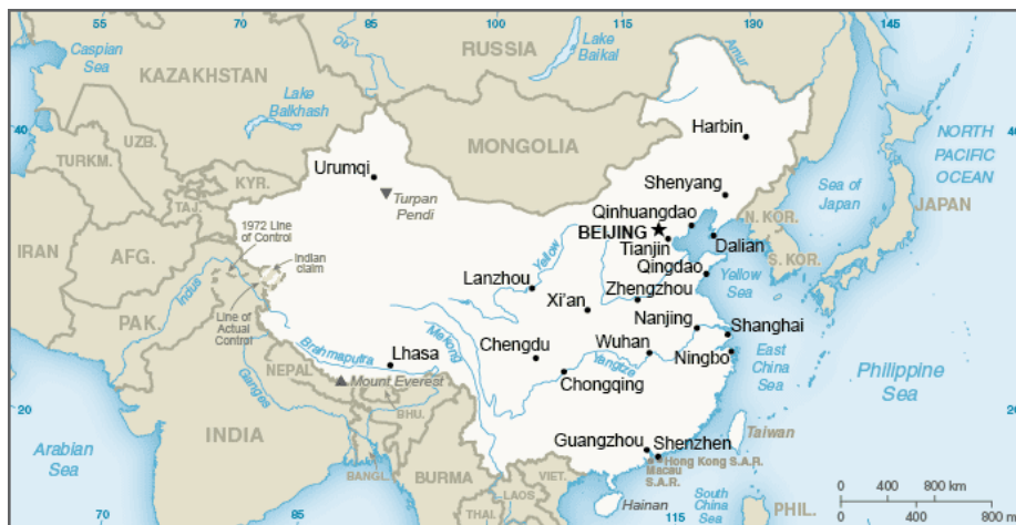
Figura 2 - Mapa dos rios da China

Levando em conta que a bacia hidrográfica fica sob o domínio daquele Estado em que se encontra a nascente, quem controlar o Tibete também possui poder sobre um importantíssimo potencial hídrico. Dessa forma, a China controla as reservas de água de treze países vizinhos, o equivalente à 50% da população mundial (NOTARIO, 2015). O potencial hidrográfico apresentado é, portanto, um notável motivo para o interesse estrangeiro sobre o Tibete, também justifica a cautela chinesa nessa região.