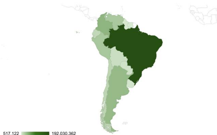
Gráfico 2: População da América do Sul