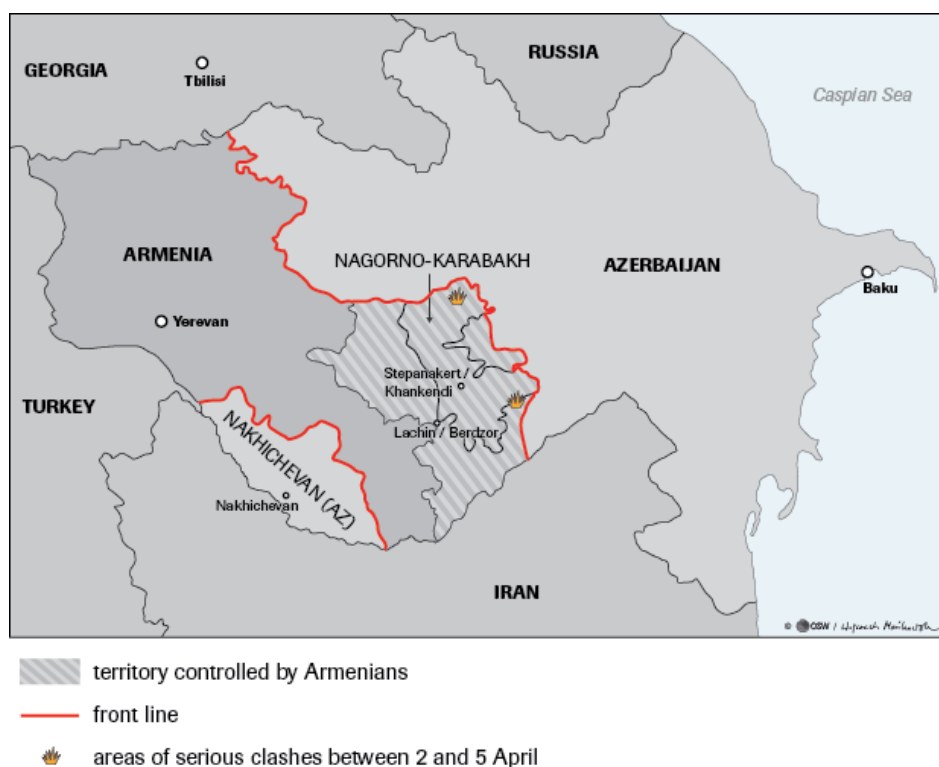
Figura 1: Mapa da divisão territorial em Nagorno-Karabakh