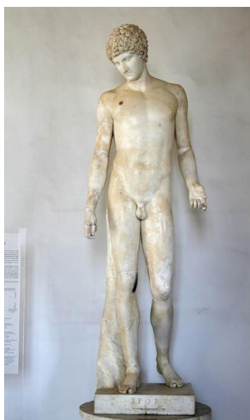
Antínoo Capitolino, estátua descoberta na Vila Adriana e atualmente preservada nos Museus Capitolinos, em Roma

O autor Suetônio, do século II da era comum, no livro “As vidas dos doze Césares”, relata que apenas o imperador Cláudio se interessava exclusivamente por mulheres, e que todos os outros tiveram meninos ou homens como amantes. O imperador Adriano (que governou de 117 a 138), apaixonado pelo jovem Antínoo, mandou construir uma grande quantidade de bustos e estátuas em sua homenagem, como mostra a figura abaixo: