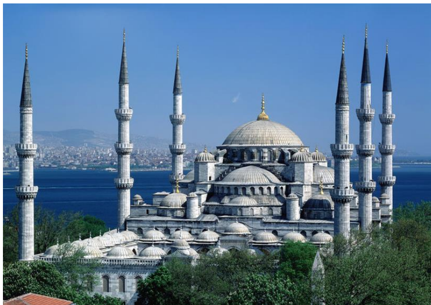
Figura 6 - Mesquita Azul de Istambul ou Mesquita do Sultão Ahmed

Quando foi construída, a Mesquita contava também com edificações adjacentes com uma casa de estudos islâmicos, uma escola, um hospital, uma cozinha comunitária, além dos túmulos do Sultão Ahmet e seus filhos, mas a maior parte dessas construções foi destruída durante o século XIX.