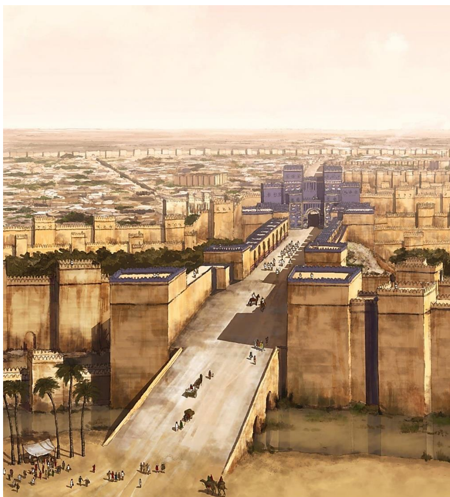
Figura 1 - Representação de como teria sido a entrada norte da cidade da Babilônia Fonte Museum Pergamon

cidade da Babilônia e por onde passavam em procissão os reis e seus convidados, e por onde desfilavam as estátuas das divindades durante as festividades de Ano Novo. O caminho para chegar até o Portal possuía quase 500 metros de comprimento, com muralhas que chegavam a 15 metros de altura. Chamada de May the Enemy not Prevail , ou “O inimigo não prevalecerá”, a Via Processional, tinha a finalidade de fornecer um cenário adequadamente impressionante para aqueles que chegavam a cidade (Figura 01).