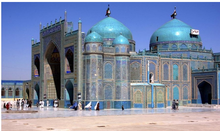
Figura 4 - Mesquita Azul, ou Mesquita de Mazar-i-Sharif | Afeganistão

Conhecida como Mesquita Azul, seu nome oficial é Mesquita de Mazar i Sharif, que vem a ser o nome da cidade onde ela se localiza. Mazar i Sharif é uma cidade ao norte do Afeganistão, na província de Balkh. O prédio como conhecemos hoje, foi reconstruído no século XV por volta do ano de 1481 pelo Sultam Husayn Bayqarah Mirza. Anteriormente este mesmo prédio havia sido parcialmente destruído durante a invasão de Gengis Khan em 1220. Uma lenda local afirma que a mesquita inteira foi enterrada para protegê-la dos exércitos mongóis, embora nenhuma evidência tenha sido encontrada para apoiar essa afirmação.