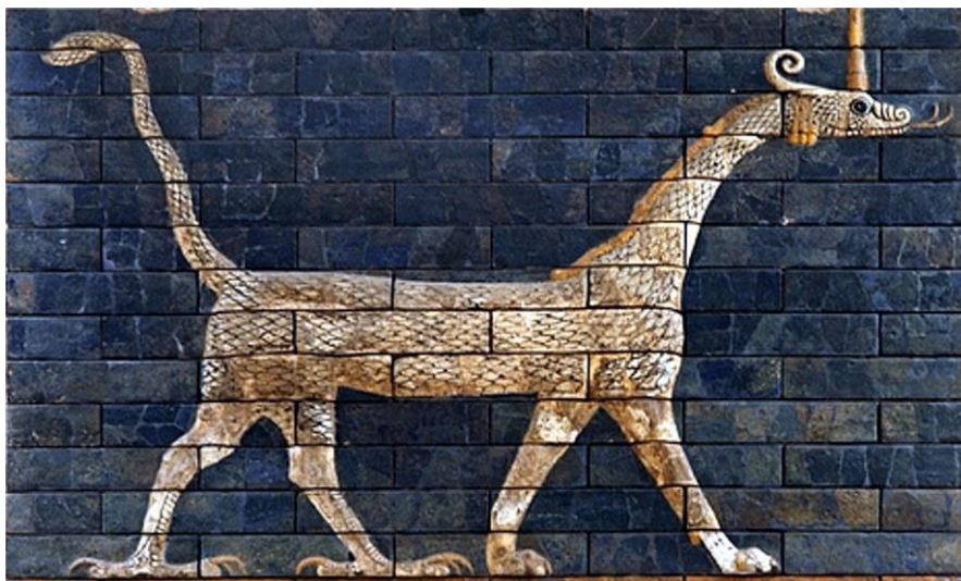
Figura 2 - Detalhe do Portal de Ishtar representando o Dragão de Marduk

verdade o dragão é um desenho híbrido, onde percebemos a cabeça de uma cobra, o corpo de um dragão e os pés de um leão, tendo o objetivo de unir forças (Figura 02).