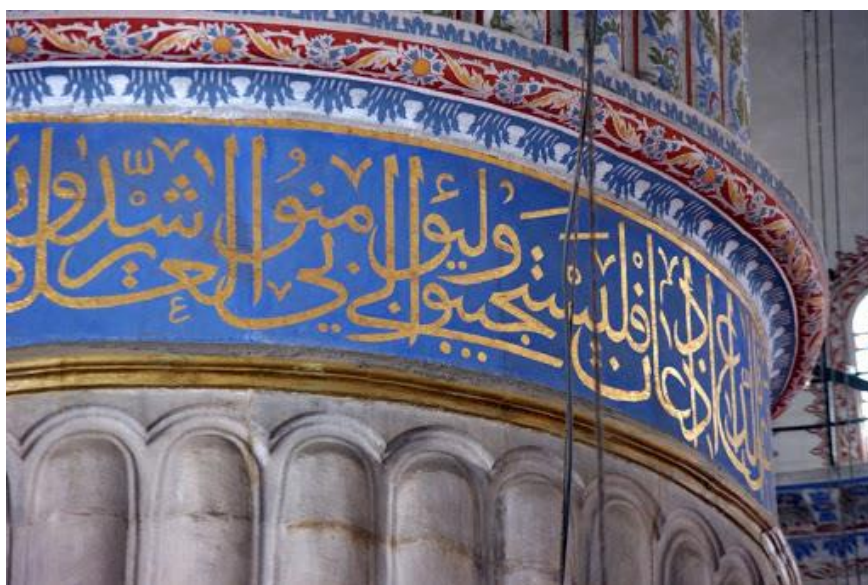
Figura 7 - Caligrafia com trechos do Alcorão, serve com o adorno

As cores deste período são: turquesa, azul de cobalto e preto. Os tijolos esmaltados e os não esmaltados produzidos nesses tons são usados com diferentes arranjos, composições horizontais, verticais, ziguezagues ou diagonais. As cores utilizadas são influenciadas pela tonalidade das pedras semipreciosas. No caso do azul, se buscava uma proximidade com o tom do Lápiz-lazúli, a pedra da qual já comentamos anteriormente que representava poder e se destacava por sua raridade e valor. Os desenhos padronizados refletem os valores alegóricos e simbólicos, reflexo da relação entre o indivíduo e o céu. Os desenhos que contém caligrafia geralmente refletem o pensamento e a filosofia islâmica (Figura 07).