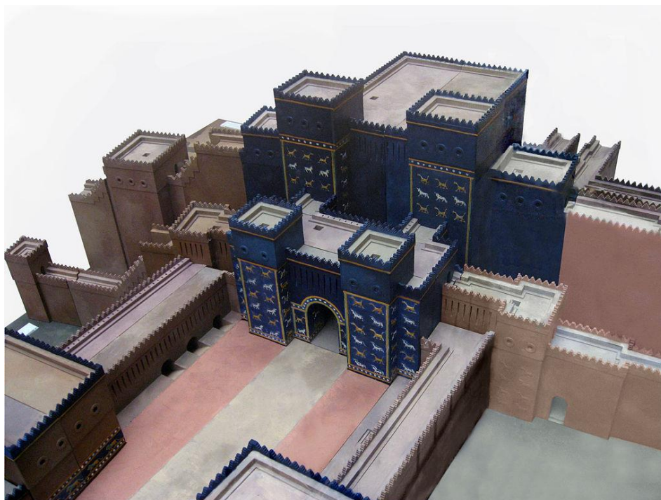
Figura 3 - Maquete reproduzindo as duas seções frontais do Portal de Ishtar

principalmente o de Ishtar, tinha a intenção de ostentar poder. Diante do Portal de Ishtar era fácil se sentir temeroso com relação ao poderio daquela cidade, pois se eles tinham um portal azul, imaginava-se que possuíssem muitas riquezas e armas.