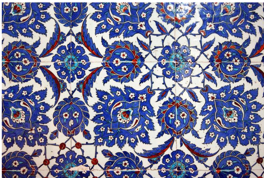
Figura 8 - Detalhe dos arabescos que decoram o interior da Mesquita

Conhecidos como motivos Tawriq, esses arabescos são uma elaborada combinação de formas orgânicas frequentemente semelhantes às formas de plantas (Figura 09). Os arabescos são elementos da arte Islâmica, normalmente usados para enfeitar as paredes das mesquitas a partir do século XVI/XVII. A escolha das formas geométricas e a maneira como devem ser usadas e formatadas é fruto da visão Islâmica do mundo. Para os muçulmanos, essas formas em conjunto, constituem um padrão infinito que se estende para além do mundo visível e material (Leite, 2007). Para muitos no mundo Islâmico, tais formas simbolizam o infinito, e por conseguinte, a natureza abrangente da criação do Deus único. A utilização da cor azul em grande parte se dá ao fato dessa tonalidade expressar serenidade, confiança, aproximação com o divino e o poder daqueles que habitam os céus.