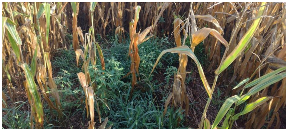
Figura 6 – Segunda época de semeadura tratamento em V5, grande incidência de invasoras.