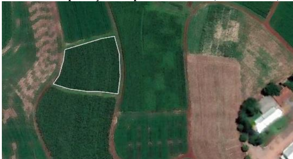
Figura 1 – Área de implantação do experimento. UTFPR, Dois Vizinhos, PR, 2022.