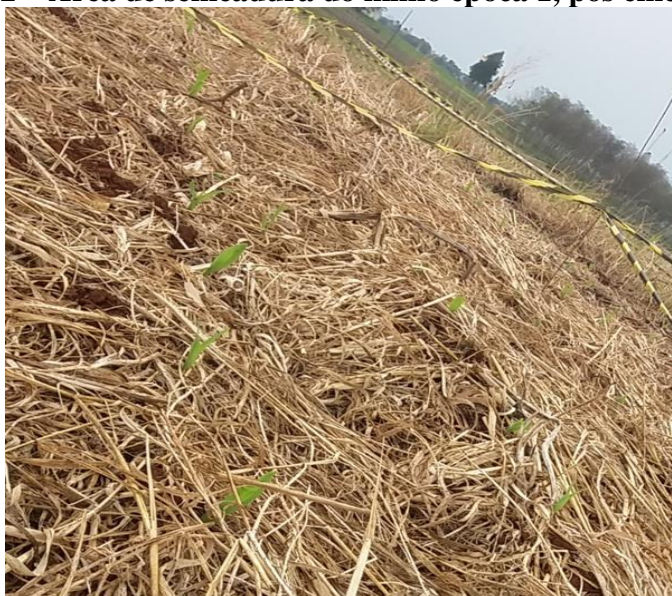
Figura 2 – Área de semeadura do milho época 1, pós emergência.

As plantas semeadas em 24/08 levaram onze dias para completar emergência. Já as semeadas em 14/09 levaram nove dias para completar a emergência. Em ambas as épocas de semeadura, a germinação ocorreu de maneira uniforme. (Figura 2).