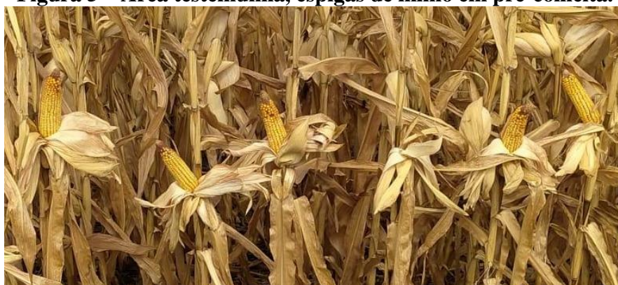
Figura 5 – Área testemunha, espigas de milho em pré-colheita.

Uma particularidade para essas elevadas quebras produtivas é o fato de que diferente de uma situação em que todas as plantas da lavoura foram desfolhadas por granizo ou danificadas pela geada, no experimento, apenas algumas parcelas eram cortadas, simulando os danos. Logo, plantas novas ficaram muito mais sensíveis ao ataque de pragas, como cigarrinha e percevejo, pois o corte deixa os tecidos da planta exposto e também sem as folhas não realizam fotossíntese, resultando em menos energia para produzir compostos para defesa. É de conhecimento o hábito migratório da Dalbulus maidis de plantas mais velhas para plantas mais novas, o que pode ter favorecido para os baixos tetos produtivos.